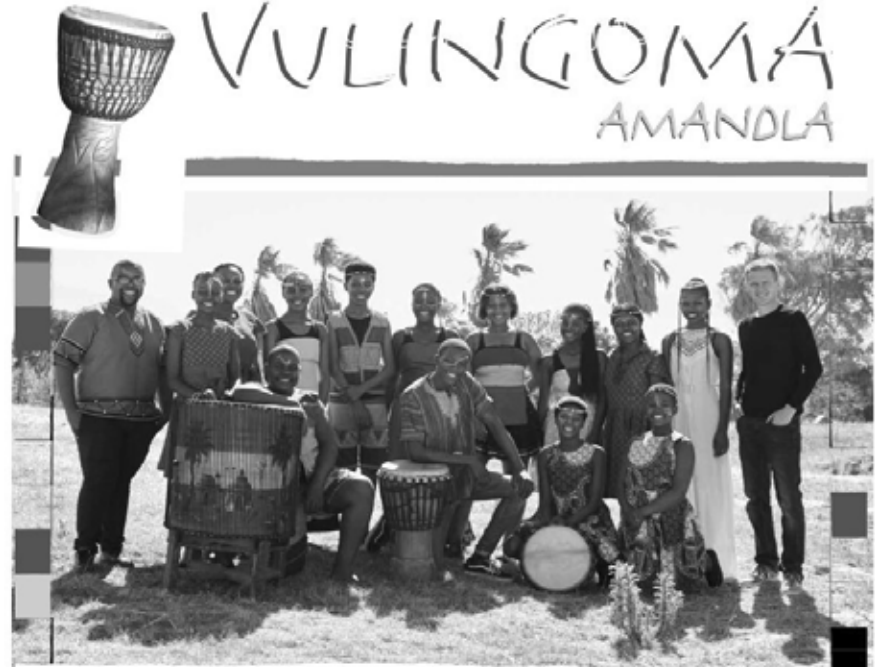
Ein Stück afrikanische Kultur: Gesungen und getanzt von Jugendlichen aus dem Kinderhilfsprojekt VULAMASANGO in Kapstadt.